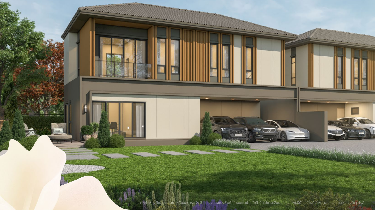
ภาพที่แสดงคือแบบจำลอง 3D ที่สร้างขึ้นด้วยคอมพิวเตอร์ ซึ่งแสดงการแบ่งพื้นที่ใช้สอยเท่านั้น ทั้งนี้เป็นไปตามเงื่อนไขของทางบริษัทฯ บ้านที่จำหน่ายไปรวมการตกแต่งใดๆ ทั้งสิ้น