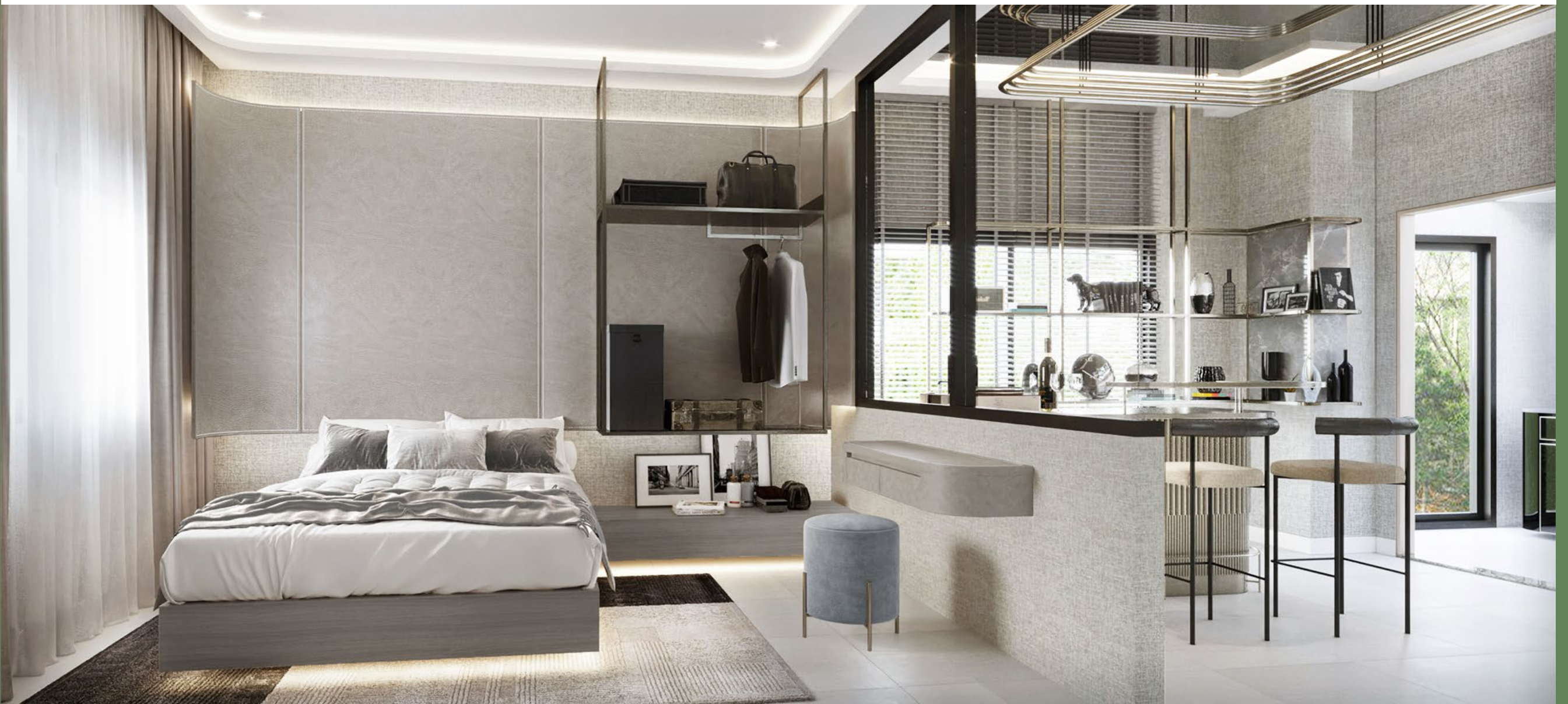
1F OPTION 2