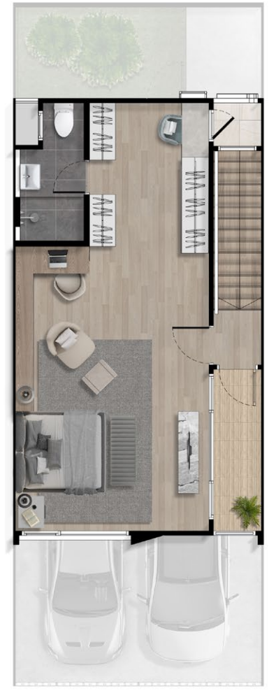
3F OPTION 1