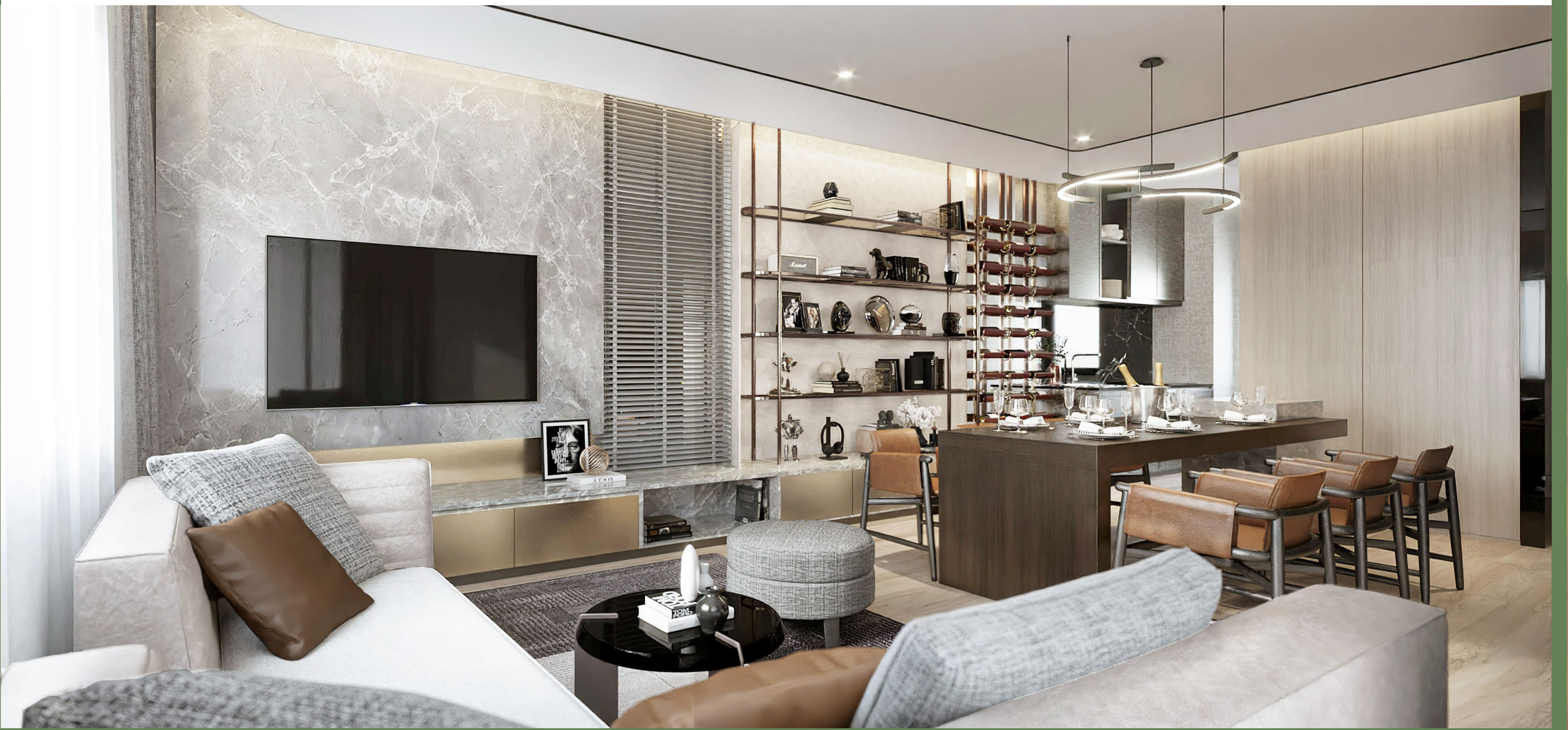
1F OPTION 3