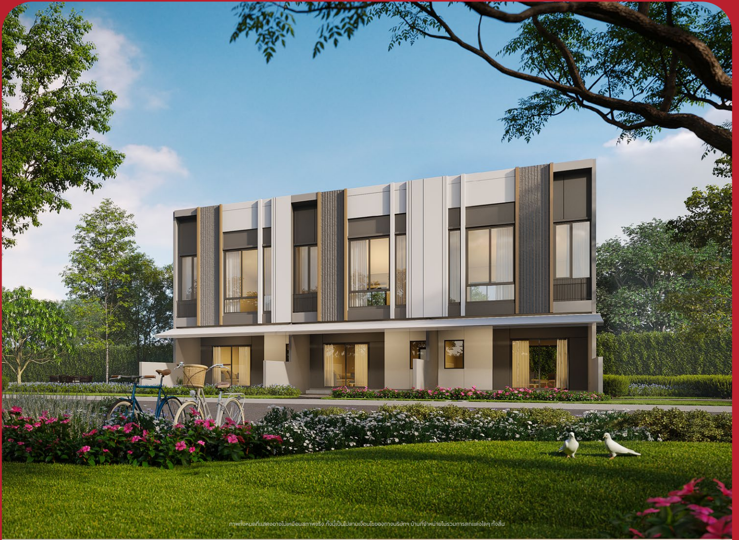
ภาพทั้งหมดที่แสดงอาจไม่เหมือนสภาพจริง ทั้งนี้เป็นไปตามเงื่อนไขของทางบริษัทฯ งานที่จำหน่ายในโครงการแตกต่างกันไป