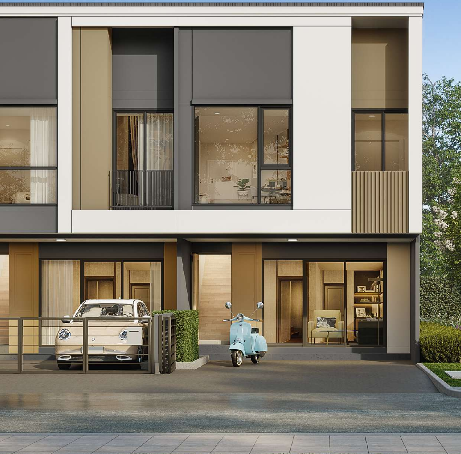
ภาพที่มองเห็นแสดงอาจไม่เหมือนสภาพจริง ซึ่งแสดงการแบ่งพื้นที่ใช้สอยเท่านั้น ทั้งนี้เป็นไปตามเงื่อนไขข้อต่อทางบริษัท บ้านที่จำหน่ายไม่รวมการตกแต่งใดๆ ทั้งสิ้น