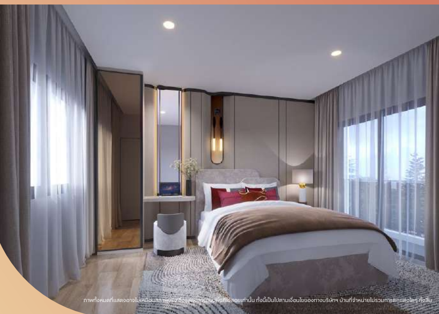
ภาพทั้งหมดนี้แสดงสถานที่ในโครงการนี้ทั้งหมด ซึ่งแสดงถึงสิ่งที่ดีที่สุดที่เรามีให้ ตอนนี้มันไม่มากเกินไปได้ของทางบริษัท บ้านที่จำหน่ายไม่รวมรถและเฟอร์นิเจอร์