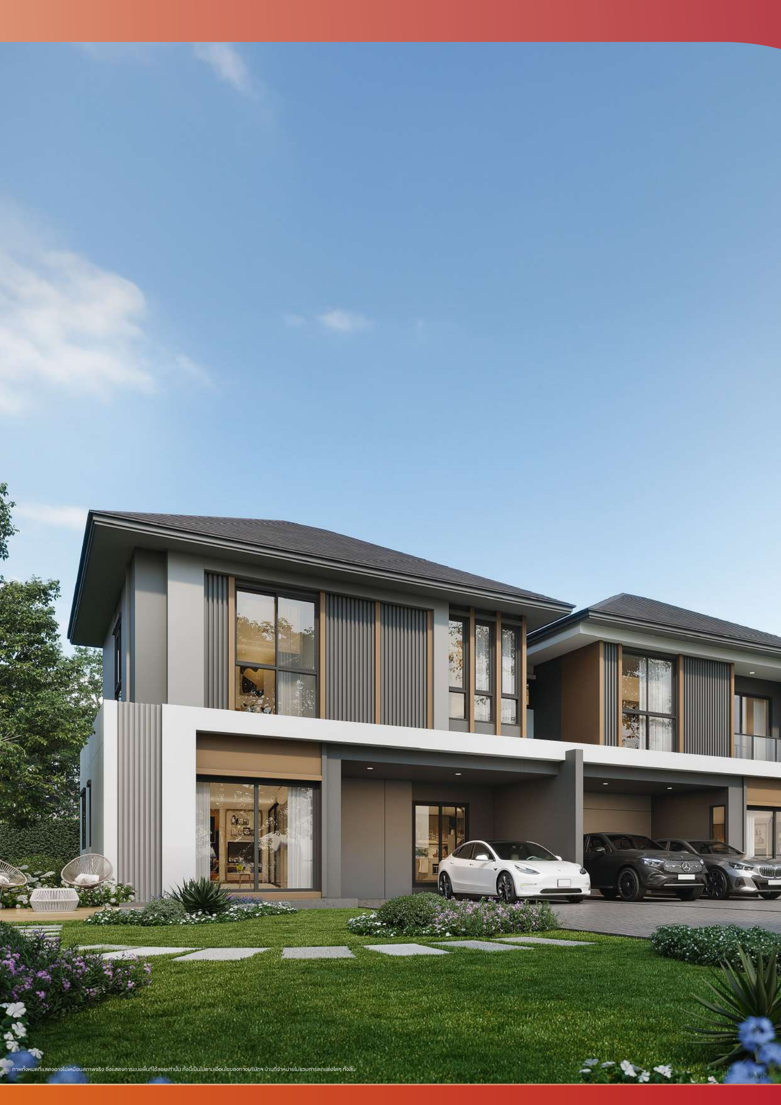
ภาพทั้งหมดที่แสดงอาจไม่เหมือนสภาพจริง ซึ่งแสดงการแบ่งพื้นที่โดยเท่านั้น ทั้งนี้เป็นไปตามเงื่อนไขของทางบริษัท บ้านที่จำหน่ายไม่รวมการตกแต่งใดๆ ทั้งสิ้น